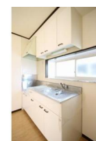
出窓付きで手元が明るいです